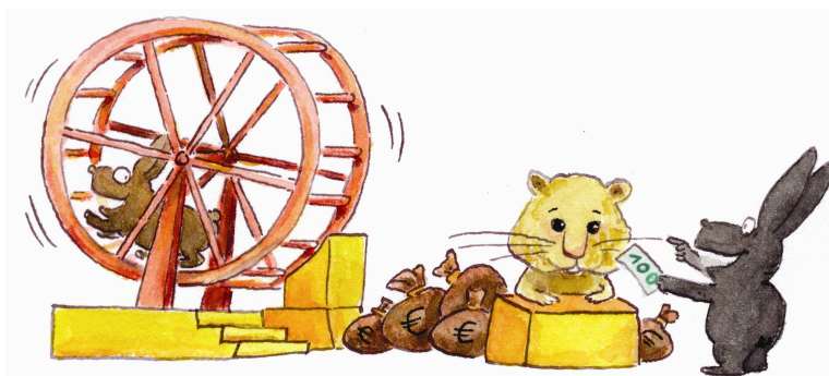
Tabelle 1: Teilnehmende Schulen (Stand 11/2006)